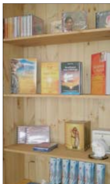
In Dunja's World finden sich auch einschlägige Bücher, CDs usw.

Meditationen sind auch noch ein Standbein in Dunja's World. Da geht