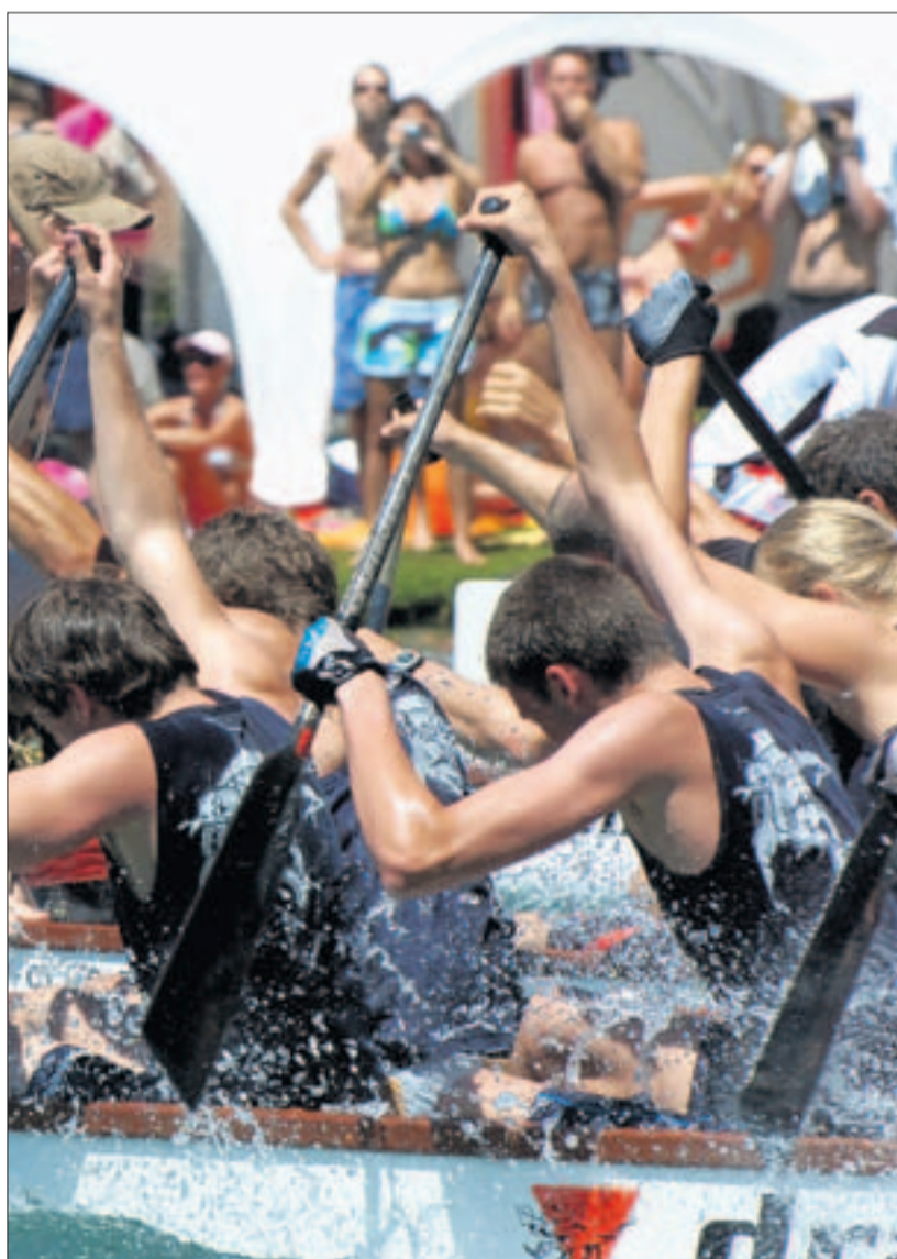
Im traditionellen asiatischen Drachenboot geben Trommeln den Takt an, in welchem Rhythmus die 20 Sportler paddeln müssen – auch am Samstag wieder. (zvg)

Der grösste Wassersportevent im Kanton Zürich startet am Freitagabend mit einer Party im Schützenhaus Eglisau um 22 Uhr. Der Zürcher Festveranstalter «Miami Vice» ist zu Gast und bringt die DJ's Muri, Tony Smah FX, Jovi und Ujo mit. Am Samstag an der Sommer-Beach-Party heizen ab 22 Uhr Disco Stuff, Surf Tunes und Summer House dem Publikum ein. Auch während des Rennens spielt auf dem Festgelände sommerliche Musik. (ct)